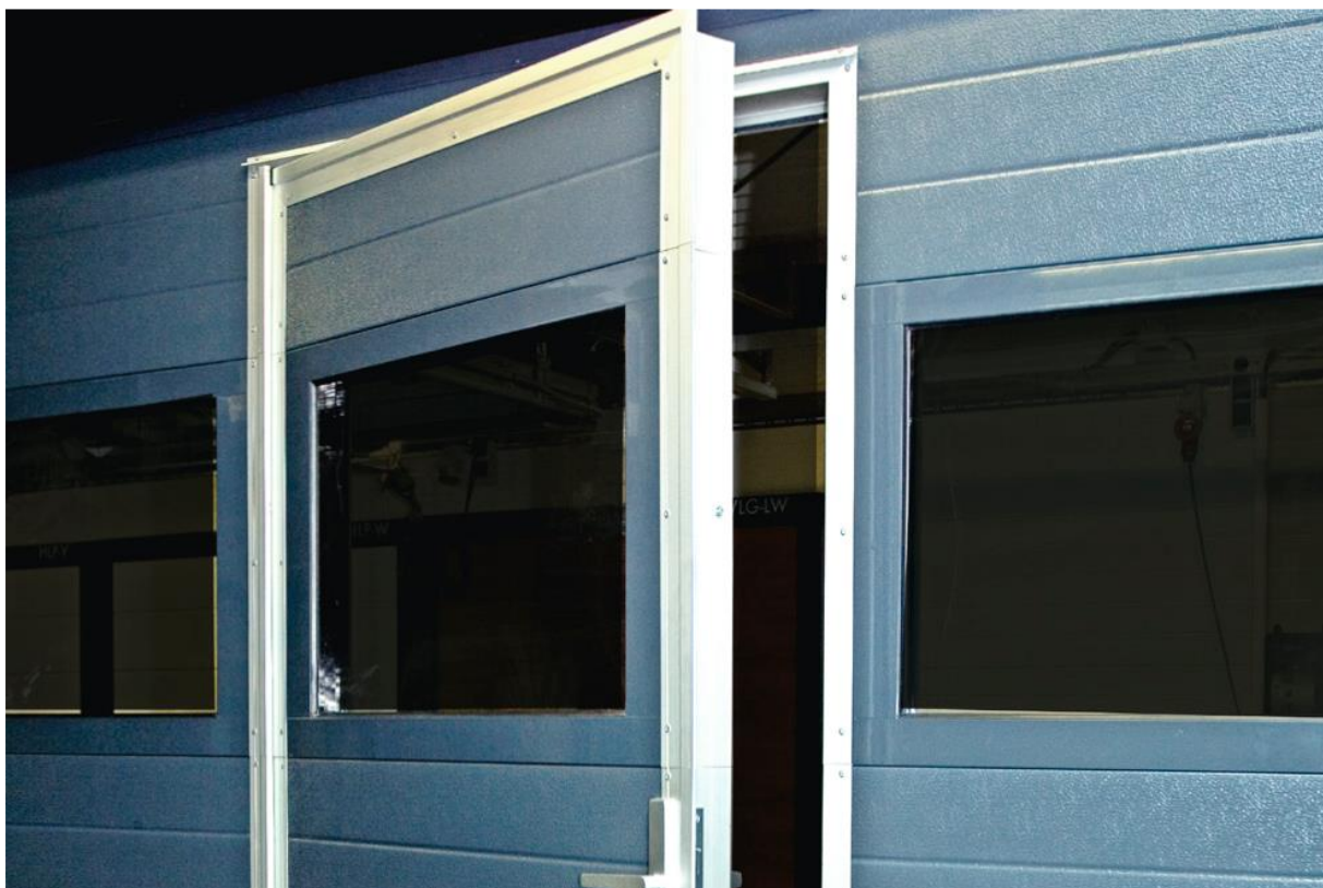
Ușile secționale S80 corespund standardelor EN 13241 / EN 12428 / EN 673.