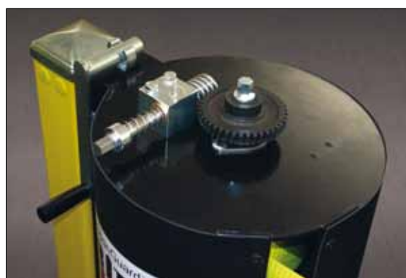
Cilindru de stocare din ABS negru cu raport de 20:1 pentru o tensionare facilă.