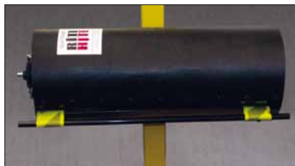
Cilindru se rotește 90 de grade pentru o depozitare ușoară.