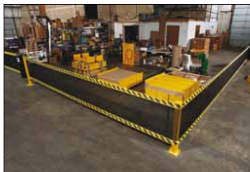
Poate fi utilizat în diverse configurații folosind stâlpii de colț.

ȚINE PERSOANELE ȘI ECHIPAMENTELE ÎN AFARA ZONELOR DE RISC.