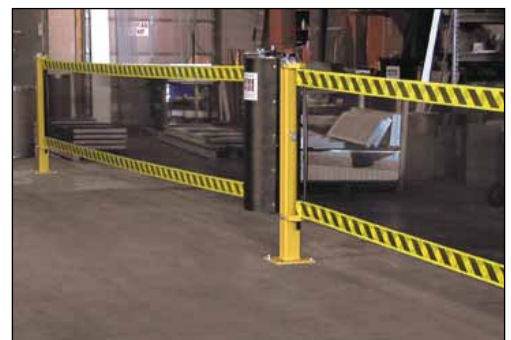
Se pot poziționa 2 sau mai multe sisteme SpanGuard pe un singur stâlp.